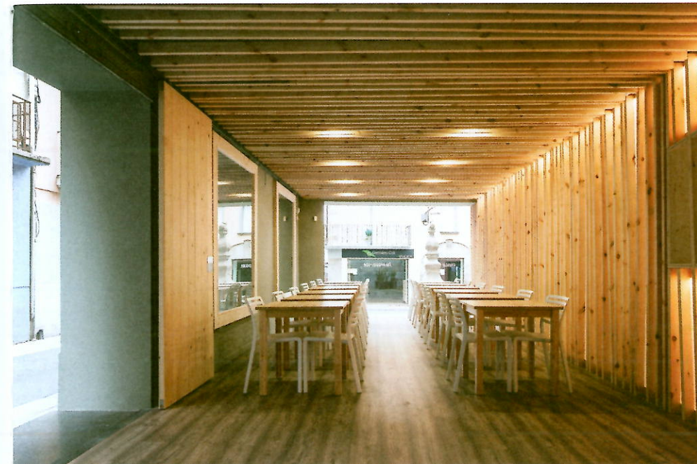
▲ La terrasse ouverte sur trois côtés dissimule des portes vitrées à galandage qui permettent de l'isoler de la rue.