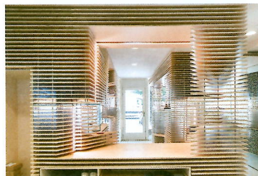
▲ Les luminaires dissimulés viennent souligner les lignes géométriques de l'aménagement.