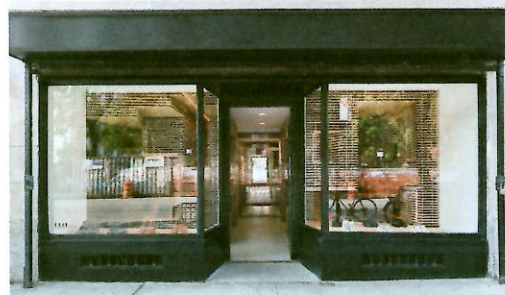
▲ La devanture sombre contraste avec l'aménagement de bois.