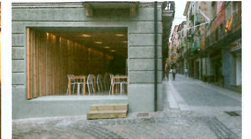
▲ Les tonalités chaleureuses de la terrasse répondent au caractère animé de la rue qu'elle longe.