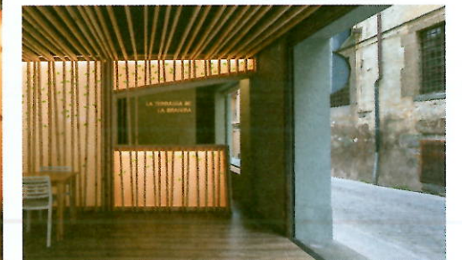
▲ Les plaques de polycarbonate diffusent la lumière et dématérialisent la paroi par un effet de profondeur.

Les rues étroites qui serpentent au cœur de la petite ville d'Olot en Catalogne abritent depuis 2014 une terrasse d'un modèle hybride. Un cocon taillé dans l'emprise bâtie pour proposer à la ruelle une nouvelle épaisseur.