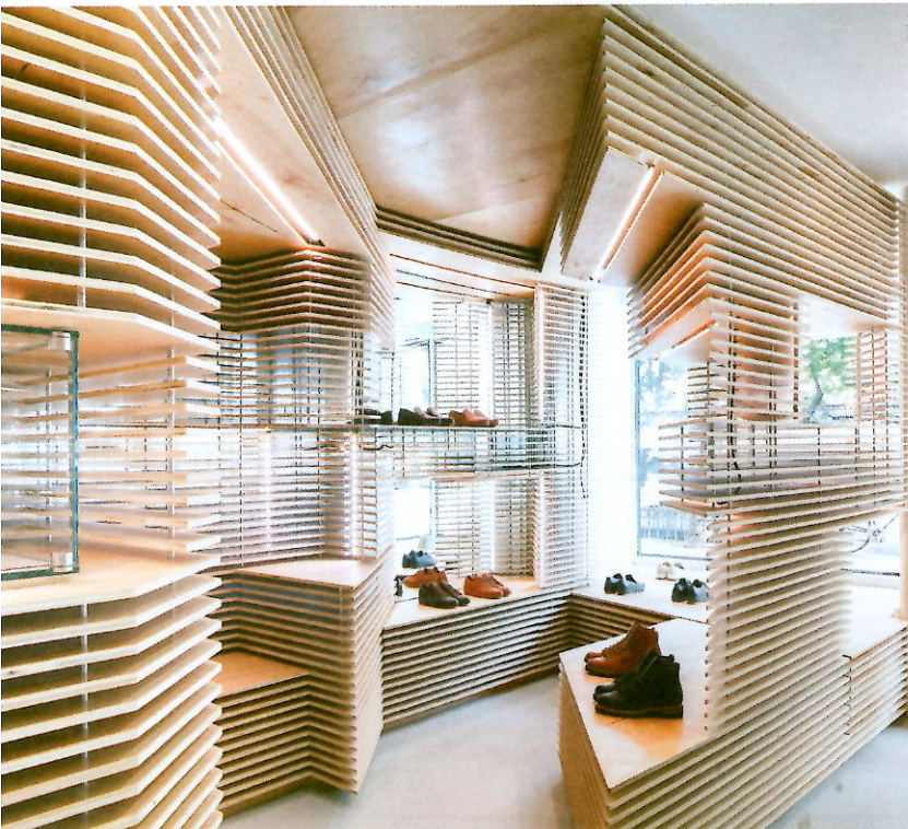
▲ Le contreplaqué laissé brut s'accorde au travail artisanal du cuir des paires de chaussures.