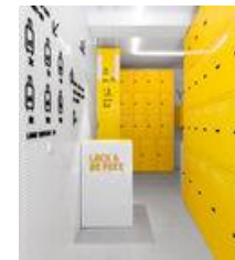
Lock & Be Free / Wanna One