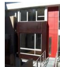
Casa DF / Santiago Cordeyro Arquitectos