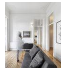
Departamento NANA / rar studio