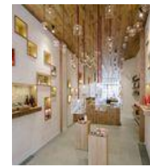
La Melguiza / ZOOCO Estudio