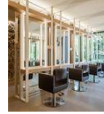
Salón Raffel Pagès Olot / Arnau Vergés Tejero