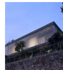
Casa Rechter / Pitsou Kedem Architects