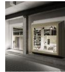
Concept Habitat / NAN Arquitectos